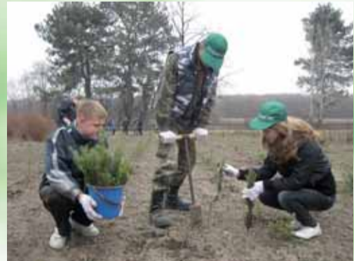
На фото: школярі-активісти Розсошенської гімназії