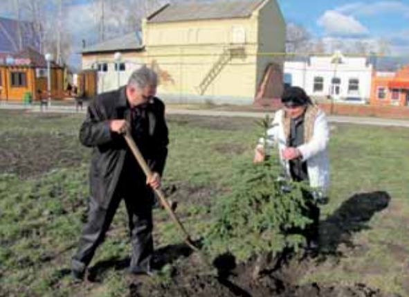
На фото: Начальник управління ОУЛМГ Юрій Тараненко та голова Котелевської райдержадміністрації, Герой України Тетяна Корост

Усі учасники заходу швидко й вправно висадили понад 50 дерев та кущів різних порід: ялину звичайну та європейську, каштани, горобину, дуб червоний, барбарис тощо. Тому те-