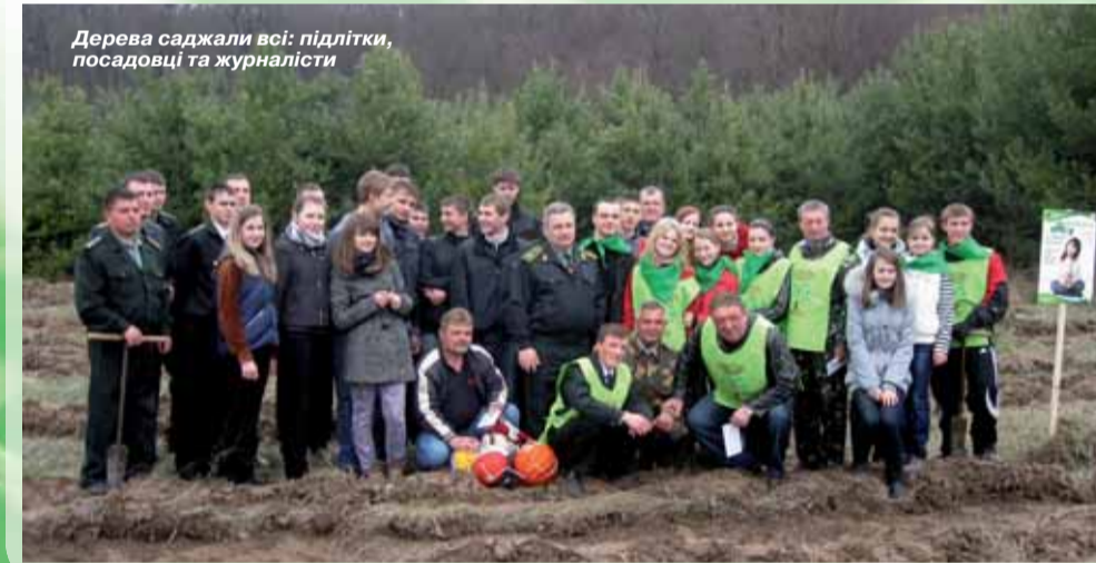
Дерева саджали всі: підлітки, посадовці та журналісти